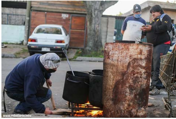
Bild: Corona-Solidarität in Uruguay: "Volksküchen" von rebelarte | Creative Commons Atribución - NoComercial 2.5