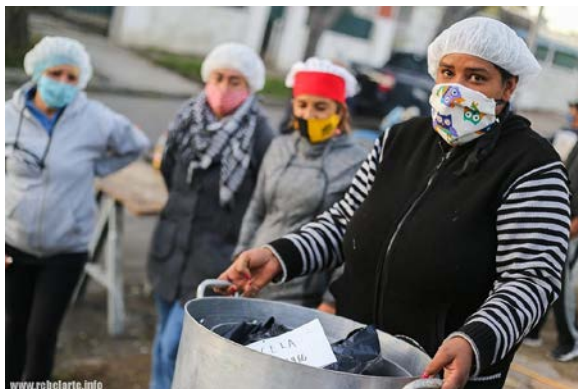
Bild: Corona-Solidarität in Uruguay: "Volksküchen" von rebelarte | Creative Commons Atribución - NoComercial 2.5

Gemein ist allen Ländern der Region, dass sich die Bewältigung der Pandemie, aber auch das künftige Zusammenleben nach Corona, an der sozialen Frage entscheiden werden.